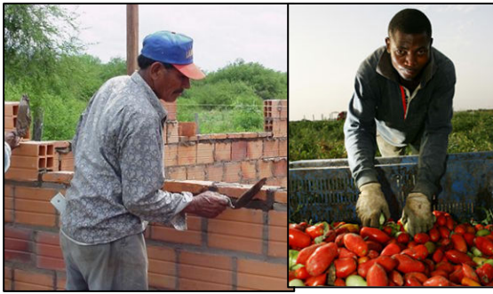
Lavori "passati di moda" per gli Italiani

perché necessari all'economia del paese. Quest'anno saranno 170.000 i visti rilasciati dalle nostre ambasciate. Poco importa se almeno il doppio di immigrati già vive e lavora in Italia, schiavizzati nelle campagne e nei cantieri. Probabilmente è più importante mantenere basso il prezzo del pomodoro. Cosa succederebbe quindi se gli immigrati sparissero improvvisamente dall'Italia? Un evento del genere è già successo negli U.S.A. In America i messicani proclamarono nel 2006 il "Day Without Immigrants", uno sciopero nazionale alla quale parteciparono milioni di immigrati latino americani chiedendo la legalizzazione. Gran parte dell'industria