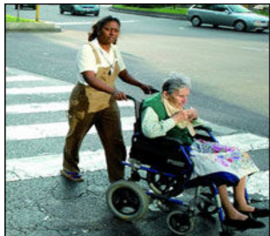
Una soluzione economica